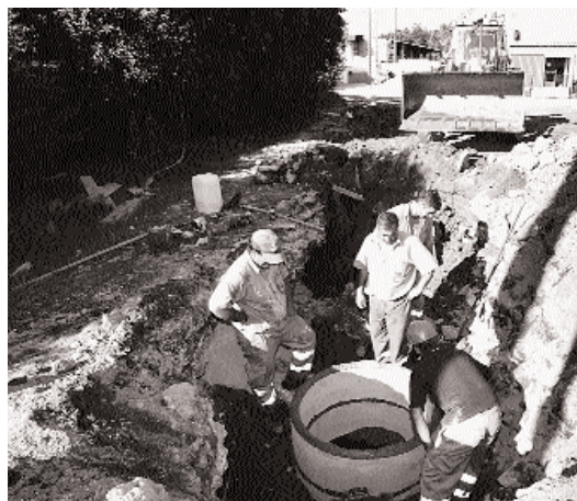
Operarios de 'Aquaquest' trabajaron durante el día de ayer abriendo una zanja junto a la fábrica conservera.

Según Sobral, "esto parece indicar que si existe algunha anomalía e que debeu de quedar por aí algún tubo que verte algo no río, pese a que a fábrica ten depuradora. Nin eles debían de ter coñecementos". ■